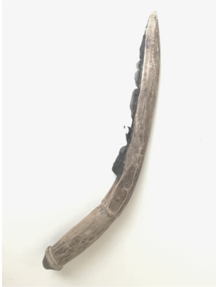
SIERP Z KRZEMIENNYMI OSTRZAMI

W kratki wpiszcie hasła znalezione przy odnalezionych skarbach