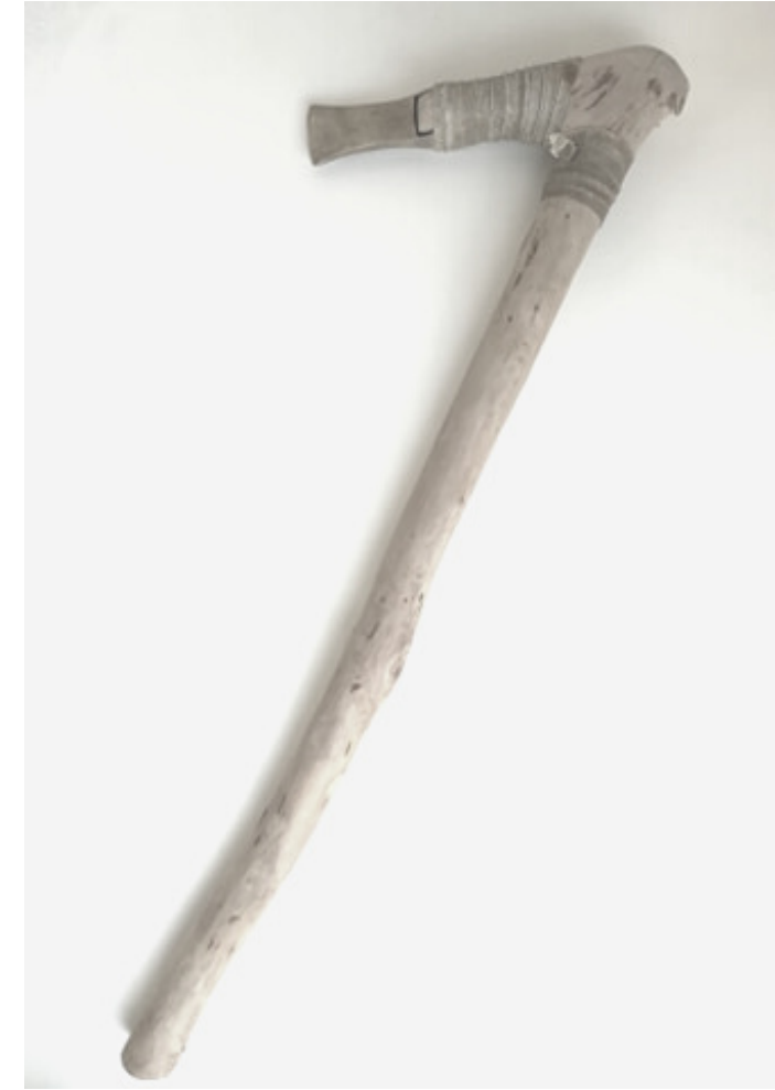
SIEKIERKA Z BRĄZU